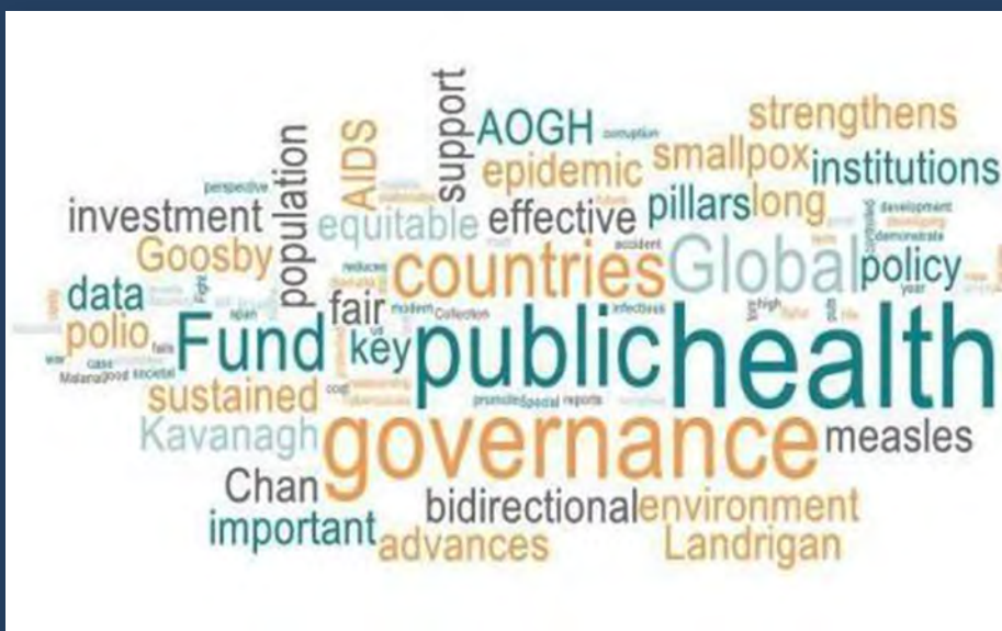
Figura 1. Palabras clave de gobernanza en salud pública.

El PDNU caracteriza a la gobernanza como un mecanismo participativo de control público.