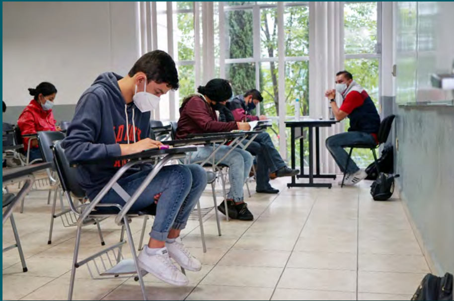
Figura 1. En México la investigación sobre la práctica docente desde las teorías implícitas ha sido muy limitada.