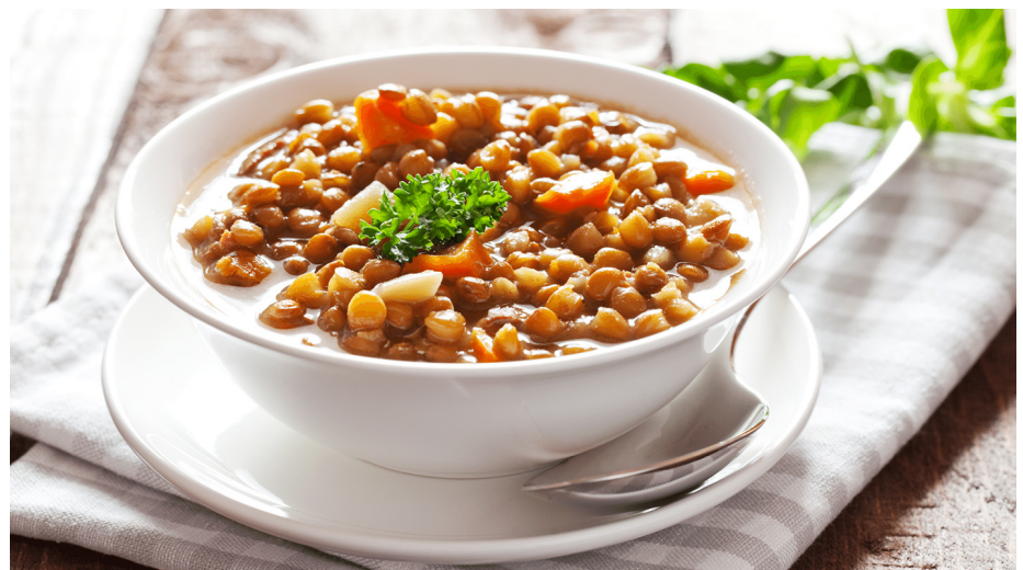
Figura 4. Sopa de lentejas, semillas transformadas por remojo y cocción.