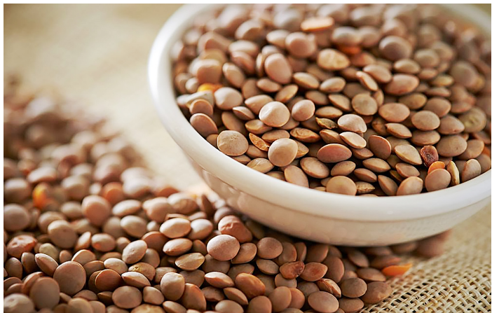
Figura 1. Semillas de lentejas ( Lens culinaris M.).