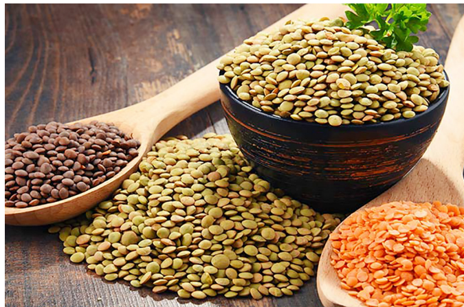
Figura 2. Semillas de lenteja identificadas en variedades por su color.