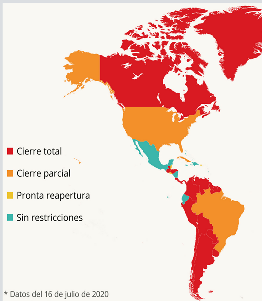
Figura 3. Restricciones de los vuelos internacionales en el continente americano.

La implementación de medidas hobbesianas para garantizar la seguridad colectiva a menudo plantea dilemas éticos. La restricción de derechos individuales puede conducir a abusos de poder, discriminación y erosión de las libertades fundamentales. Resulta entonces esencial evaluar si las restricciones son