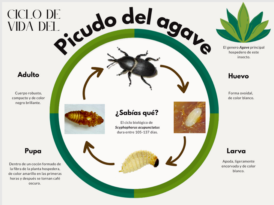
Figura 1. Ciclo de vida de S. acupunctatus.

Se sabe que la presencia del picudo está asociada a la enfermedad de podredumbre del agave, y que también hay múltiples microorganismos asociados a esta, ya sea como oportunistas o degradadores (Cuervo-Parra et al. , 2020). Su principal método de control es convencional a través del uso de insecticidas químicos de amplio espectro. Desafortunadamente, el uso excesivo de estos productos puede propiciar la alteración de sus interacciones con sus enemigos naturales, polinizadores (murciélagos, tlacuaches y palomillas) y plantas hospederas. Por lo tanto, lo ideal sería generar alternativas de control que sean más selectivas, seguras y compatibles con las prácticas de manejo y control de esta plaga.