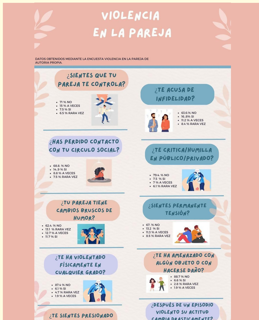
Figura 2. Infografía sobre violencia de pareja. Autoría propia

Reconocer que la violencia en la pareja puede manifestarse de diferentes maneras y en una amplia variedad de escenarios plausibles, dichos contextos abarcan situaciones tan complejas que engloban una atención poco frecuente.