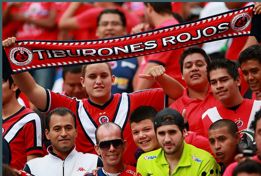
Figura 1. Las barras bravas son un ejemplo de fenómeno subcultural introducido en México (tomado de: https://www.elsiglodetorreon.com.mx/noticia/2013/aficionado-compone-cancion-para-los-tiburones-rojos.html ).

En relación con la idea que se argumentó en el párrafo anterior, me cuestiono si ¿realmente los grupos sociales han creado una identidad propia o solamente copian y adaptan lo que otros hacen y lo marcan como