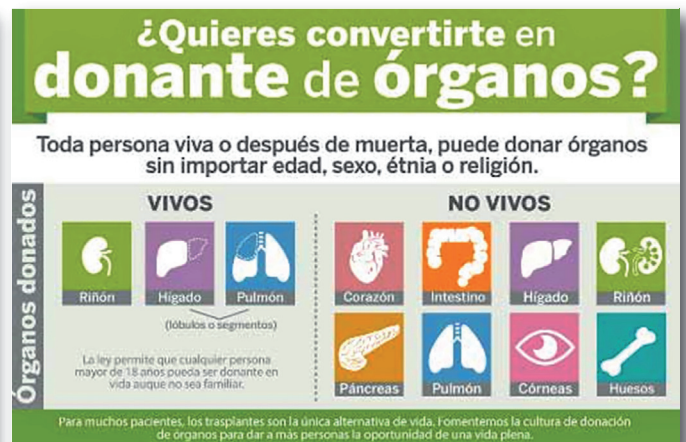
Figura 2. Diferencias entre donantes vivos y no vivos.

https://www.gob.mx/cenatra/acciones-y-programas/tarjeta-de-donador