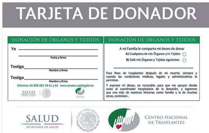
Figura 1. Tarjeta oficial de donador de órganos.

En México cuando se iniciaron los trasplantes en 1963, se realizaban en hospitales de tercer nivel, únicamente confinados en el Distrito Federal, (actualmente CDMX). En 2018 después de 38 años, contamos con 176 centros de trasplantes de los diversos órganos y