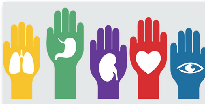
Figura 4. Donación de órganos. https://tvindependencia.com/a-la-alza-la-cultura-de-donacion-de-organos-en-el-estado-de-guanajuato/

Los documentales, películas, cortos y demás que se han elaborado a lo largo de la historia en torno al tema de donación y trasplantes en nuestro país no remonta a la difícil cultura que