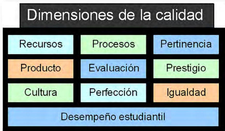
Figura 1. Dimensiones de la calidad según Martínez Alarcón (2015).