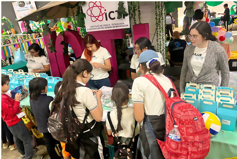
Figura 2. Armado de la maleta migrante con información general y etiquetas.