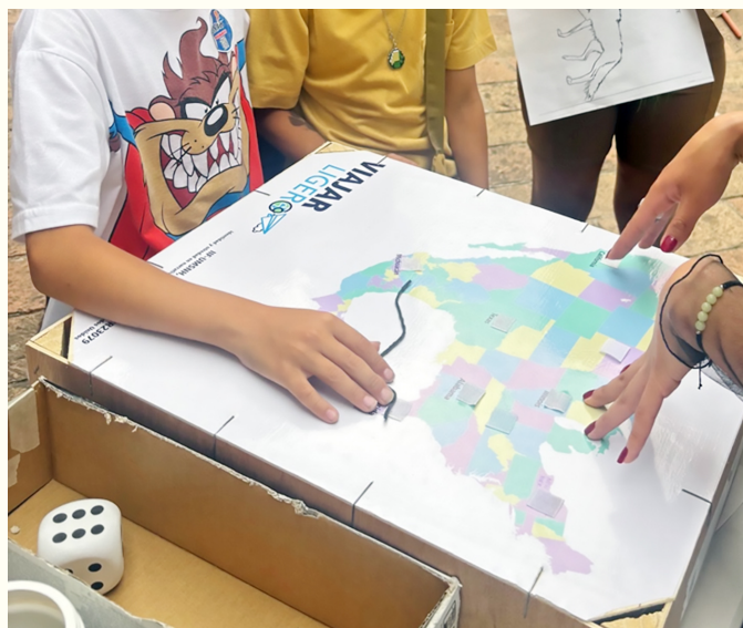
Figura 3. Participantes en la actividad del mapa, versión impresa de escritorio.