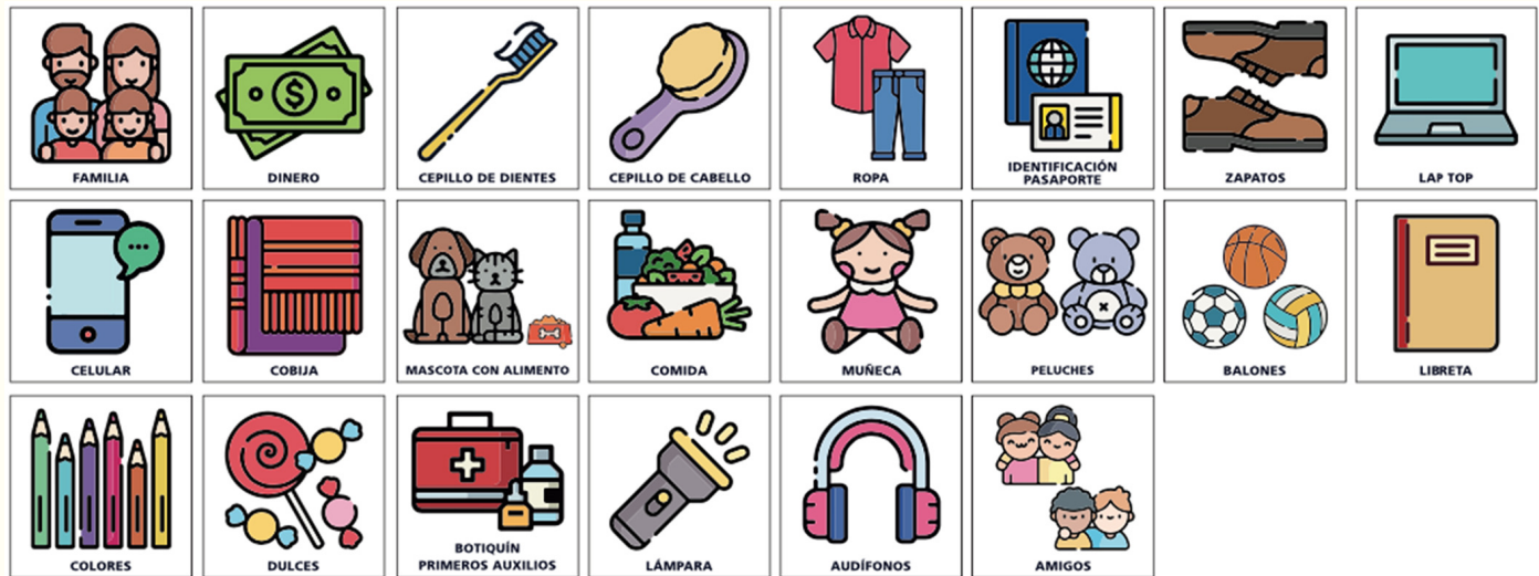
Figura 1. Imágenes de elementos de la maleta migrante