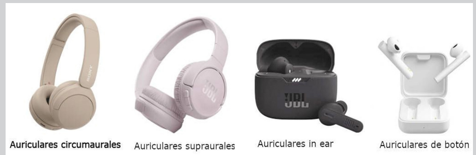
Figura 3: Tipos de auriculares.