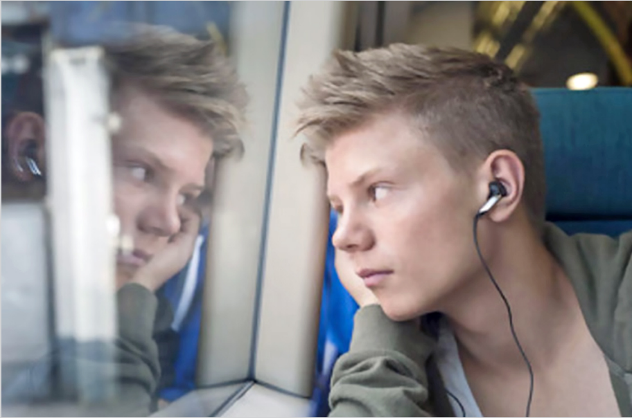
Figura 1. Aislamiento social. Jóvenes usan auriculares para aislarse (Fuente: Mundo Contact, Ugalde 2018).