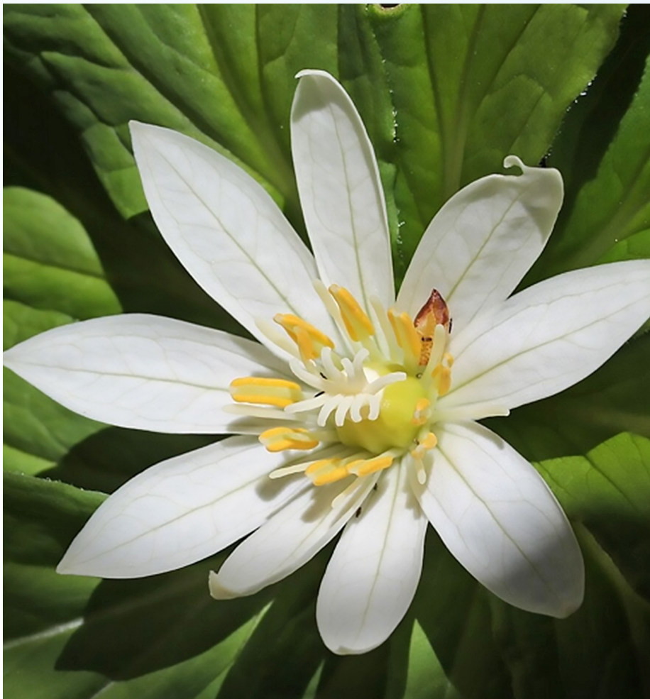
Figura 1. Flor de P. japónica especie de planta con el genoma más grande de todos los seres vivos, que es 50 veces más grande que el genoma de los humanos.

“Los éxitos logrados últimamente por la biología soviética nos permiten confiar en que esa creación artificial de